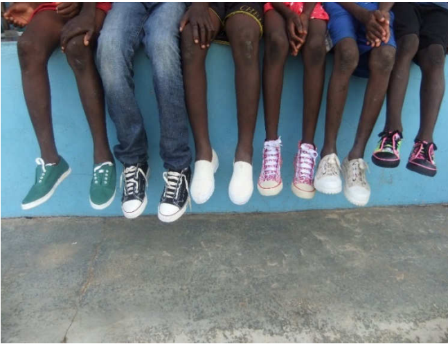
Wat schoenen op een rijtje

Met uitzondering van de drie jongens met maat 43 en 44, heeft iedereen nieuwe schoenen gekregen. Alsof de storm was uitgeraasd, keerde de rust weer terug. Mij kon je bij elkaar vegen, maar die blije gezichten maken alles goed!