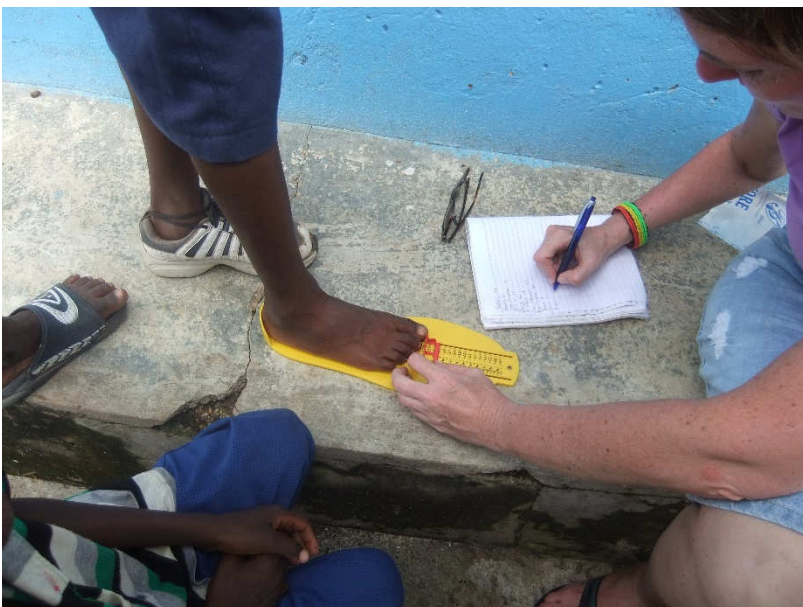
De maat opnemen

Maten waren een raadsel, dus heb ik zo'n voetenmeter mee mogen nemen. Nou, dat was toch wel iets heel bijzonders! De kids vonden het reuze interessant om zich de maat te laten meten en al gauw had ik wel tien assistentjes. Dat blijf ik geweldig vinden, hoe behulpzaam ze zijn als ik iets gedaan wil krijgen. En zij zijn erg blij met mijn lach, een complimentje, een high five of een aai over de bol.