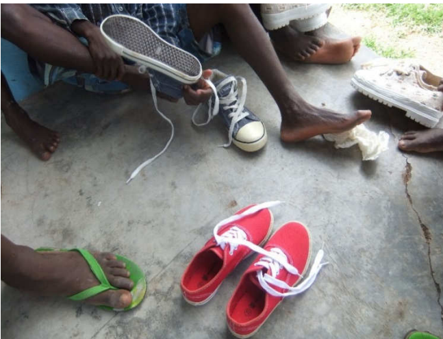
En passen maar...

En zodra je jouw schoenen had ontvangen, kon het passen beginnen. Er moesten natuurlijk veters geregen worden en als de ontvanger het zelf niet vlot genoeg voor elkaar kreeg, werd het met een kreet van ergernis door een omstander gedaan.